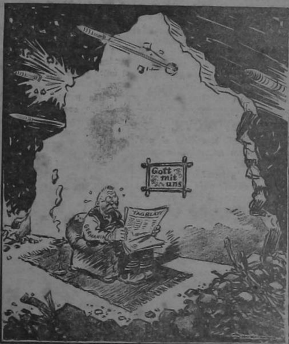
SU PROPIO ESPACIO VITAL