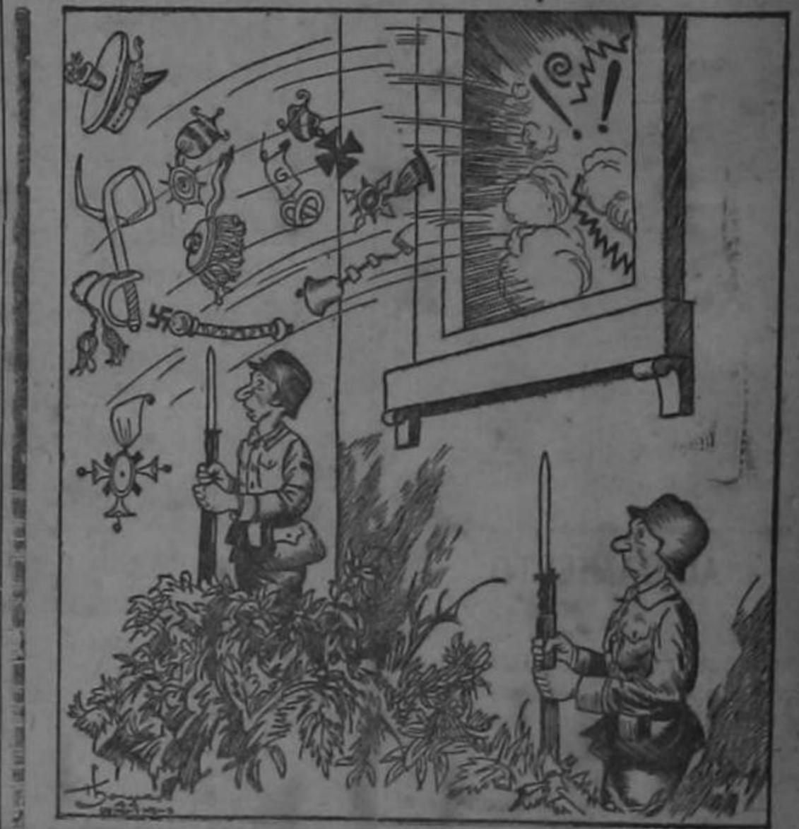
LIQUIDACION DE GENERALES ALEMANES