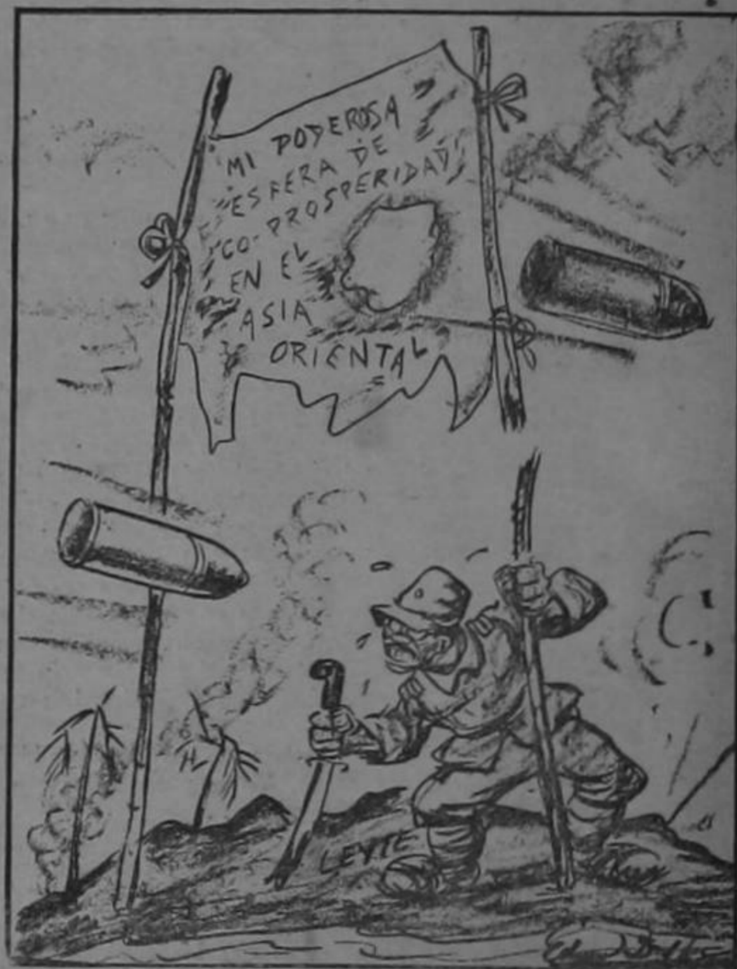
ARRECIA LA TORMENTA

—Mal; la enfermera resultó ser la esposa de él.